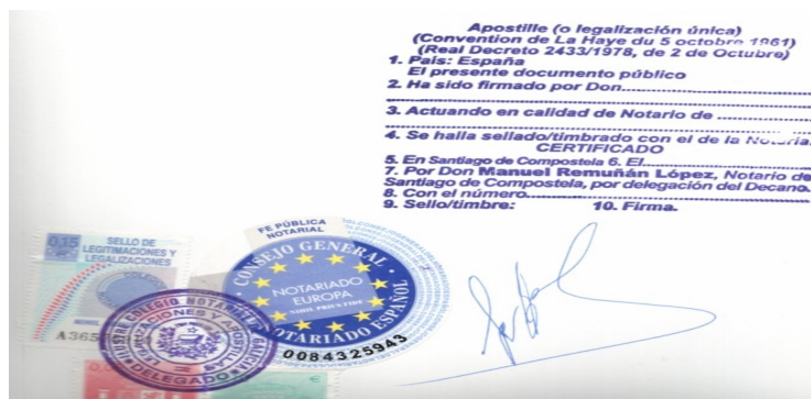
Ejemplo de legalización única “Apostilla de La Haya”