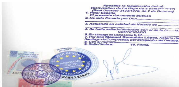
Ejemplo de legalización única “Apostilla de La Haya”