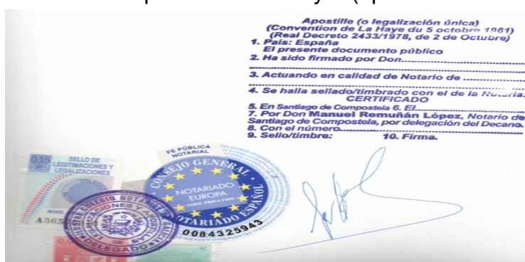
Ejemplo de legalización única “Apostilla de La Haya”