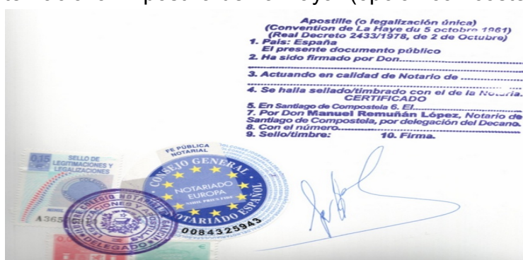
Ejemplo de legalización única “Apostilla de La Haya”