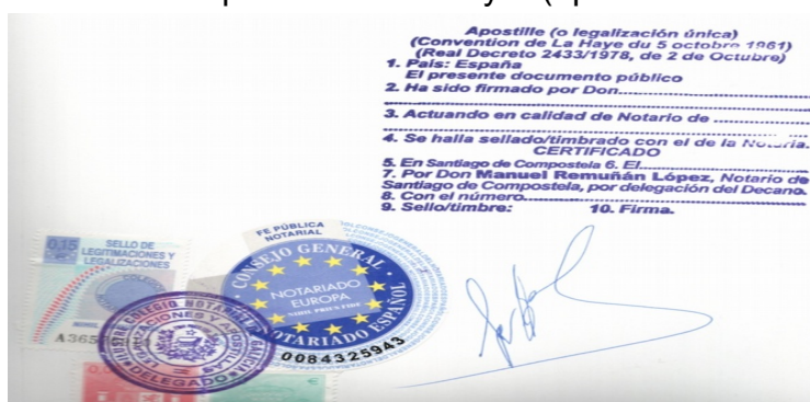
Ejemplo de legalización única “Apostilla de La Haya”