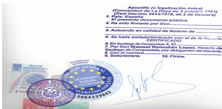
Ejemplo de legalización única “Apostilla de La Haya”