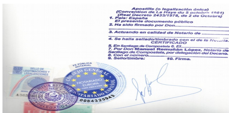
Ejemplo de legalización única “Apostilla de La Haya”