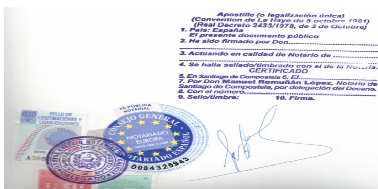
Ejemplo de legalización única “Apostilla de La Haya”